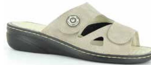
Art. 06375 MARIA

Obermaterial Leder/Stretch kombiniert, Lederfutter, Klettverschlüsse, Wechselfussbett mit Leder bezogen