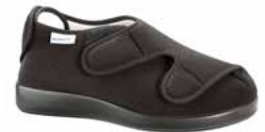
Art. 60420 DUBLIN XXL Weite R 119,-

Obermaterial Klettvelours, hygienisches Frotteefutter, Klettverschlüsse, Heckverschluss, herausnehmbare 3mm-Weichschaumeinlage