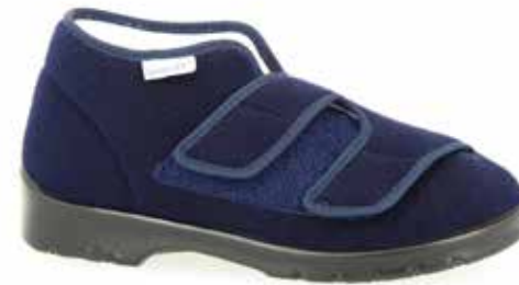
Art. 31920 GENUA Weite H 1/2 89,-

Obermaterial Klettvelours, hygienisches Frotteefutter, Klettverschlüsse, Wechselfussbett mit COOL-MAX bezogen