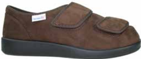
Art. 60930 GARMISCH

Obermaterial Microvelours, Trikotfutter, herausnehmbare 3mm-Weichschaumeinlage, flexible Klettverschlüsse