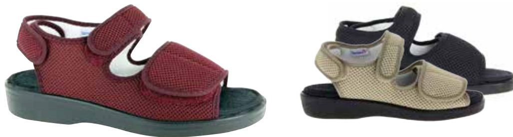
Art. 58892 GENF Weite L 98,-

Obermaterial Mesh, hygienisches Frotteefutter, Klettverschlüsse, herausnehmbare 6mm-Weichschaumeinlage mit Frottee bezogen, fixiert durch Klettpunkte