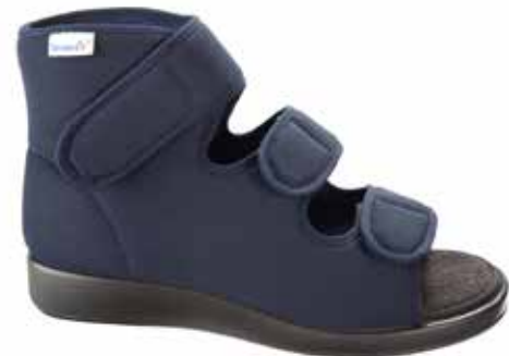
Art. 60450 RIJEKA XXL Weite R 119,-

Obermaterial Pique, Frotteefutter, Klettverschlüsse, herausnehmbare 6mm-Weichschaumeinlage mit Frottee bezogen, fixiert durch Klettpunkte