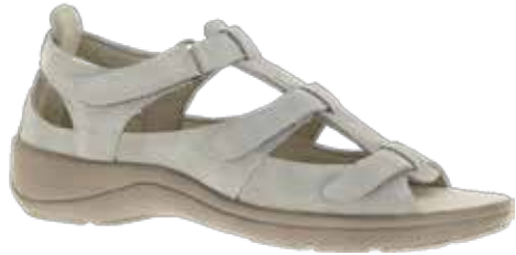
Art. 79782 CAPRI

Obermaterial Leder, Dialinofutter, Klettverschlüsse, Umlenköse, Wechselfussbett mit Dialino bezogen