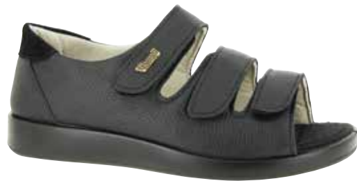
Art. 60710 KOKOLLA