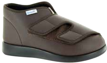
Art. 60924 LONDON

Obermaterial Lederimitat, hygienisches Frotteefutter, Klettverschlüsse, herausnehmbare 3mm-Weichschaumeinlage