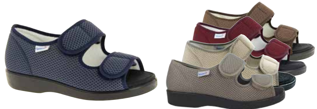
Art. 58882 GÖTEBORG Weite L 89,-

Farben & Größen 03/bordeaux Gr. 36 - 44 60/schwarz, 31/beige Gr. 36 - 46