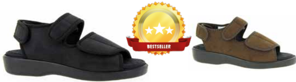
Art. 58890 LUGANO Weite L 109,-

Obermaterial Microvelours, Trikotfutter, Klettverschlüsse, herausnehmbare 6mm-Weichschaumeinlage mit Frottee bezogen, fixiert durch Klettpunkte