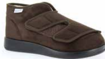
Art. 60928 GENUA - Winter 2 Weite L 98,-

Obermaterial Microvelours, Klettverschlüsse, Schurwollfutter; nicht waschbar