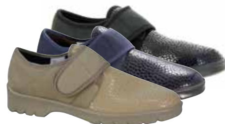
Art. 31311 STRASBOURG Weite H 1/2 109,-

Obermaterial Micro/bedruckter Stretch kombiniert, Quartier mit Trikotfutter, Klettverschluss, Wechselfussbett mit COOL-MAX bezogen