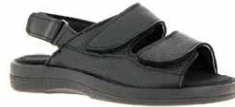
Art. 62720 HOLMESTRAND