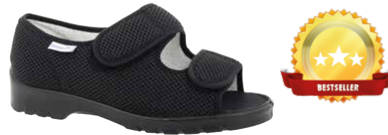
Art. 31882 ISTANBUL Weite H 1/2 89,-

Farben & Größen 60/schwarz Gr. 36 - 50 52/mocca Gr. 36 - 48