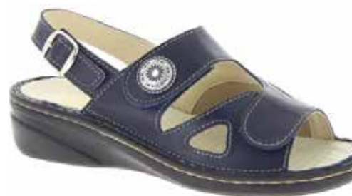
Art. 06325 ISABELL

Obermaterial Leder/Stretch kombiniert, Lederfutter, Klettverschlüsse, Hinterriemen mit Schnalle, Wechselfussbett mit Leder/Aromatex bezogen