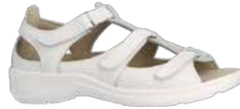
Weite H 1/2 129,-

Farben & Grössen 62/schiefergrau Gr. 3 - 8