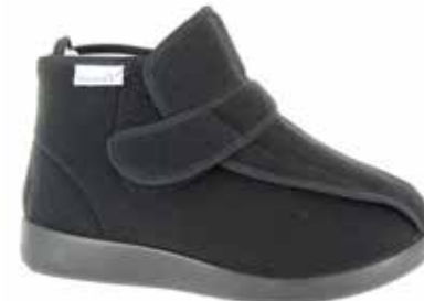
Art. 60910 MERAN Weite L 119,-

Obermaterial Klettvelours, hygienisches Frotteefutter, Ristklettlasche, Heckreissverschluss, herausnehmbare 3mm-Weichschaumeinlage