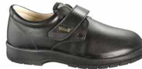
Art. 75100 OSLO

Obermaterial Leder, Dialinofutter, Klettverschluss, Wechselfussbett mit Dialino bezogen