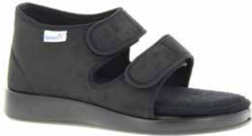
Art. 60510 PARIS XXL Weite R 119,-

Obermaterial Microvelours, Trikotfutter, Klettverschlüsse, herausnehmbare 12mm-Weichschaumeinlage mit Frottee bezogen, herausnehmbare Sohlenversteifung