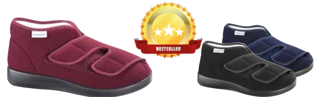
Art. 60920 GENUA Weite L 98,-

Farben & Grössen 25/marine Gr. 36 - 43 60/schwarz Gr. 36 - 43