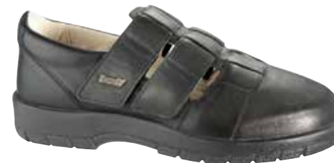
Art. 75200 KAPSTADT