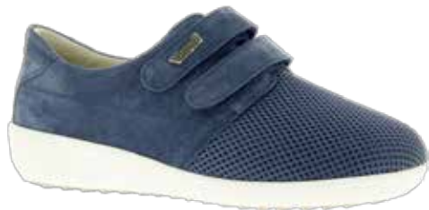
Art. 77271 MARSEILLE

Obermaterial Leder/Mesh kombiniert, Dialinofutter, Klettverschlüsse. Wechselfussbett mit Dialinofussbett