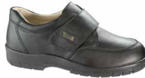
Art. 75150 BRÜSSEL

Obermaterial Leder, Dialinofutter, Klettverschluss, Wechselfussbett mit Dialino bezogen