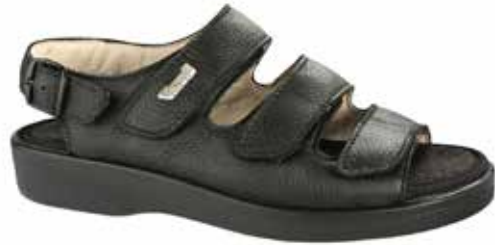
Art. 58870 TURKU