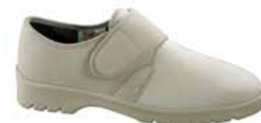
Art. 31316 WARSCHAU Weite H 1/2 109,-

Obermaterial Micro/bedruckter Stretch kombiniert, Quartier mit Trikotfutter, Klettverschluss, Wechselfussbett mit COOL-MAX bezogen