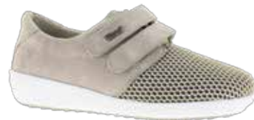
Weite K 139,-