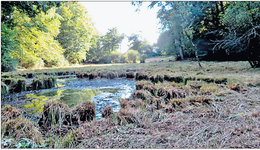
Der Töniweiher macht nach dem Einsatz wieder einen gepflegten Eindruck.