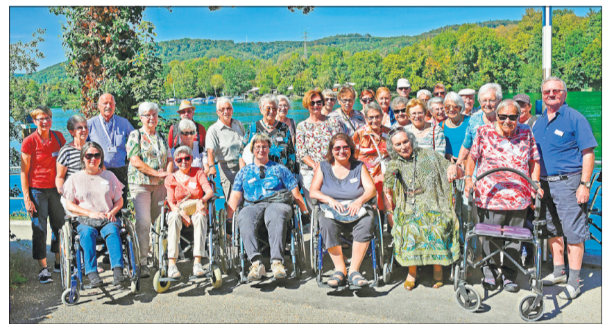
«Rhein ins Vergnügen»: Die 36 Teilnehmenden des Rotkreuz-Tagesausflugs verbrachten einen vergnüglichen Tag auf und neben dem Rhein.

Infolge des tiefen Wasserstandes des Rheins kann die Schleusenfahrt